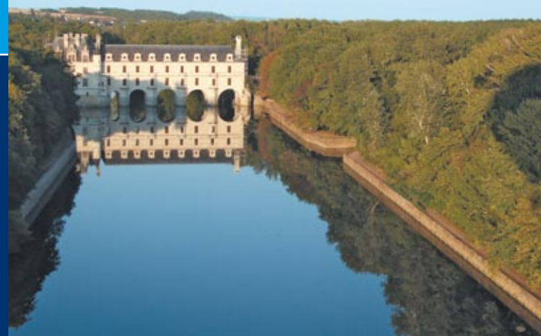
Château de Chenonceau