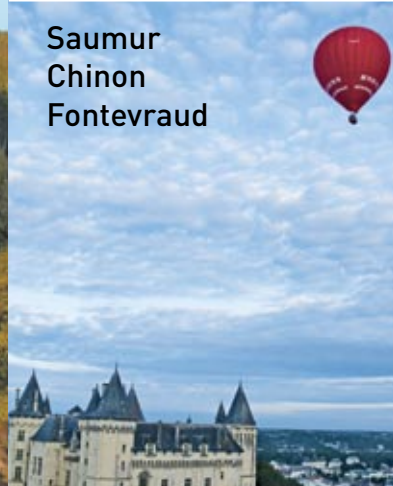
Château de Saumur